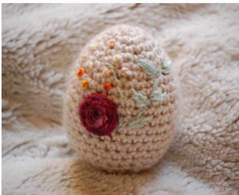
Oeuf de printemps